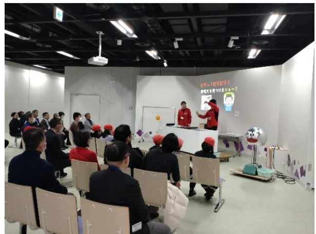
施設研修会(サイエンスショー)の様子

2日目の5日(木)は札幌市青少年科学館で、施設研修会を実施しました。科学館の石丸係長からリニューアルの概要をご説明いただいた後、科学館職員による15分間のサイエンスショー(静電気)を鑑賞しました。その後、プラネタリウムも鑑賞し、館内自由見学ののちに終了となりました。博物館が、都市部においても、地域においても、まちづくりを行う上で重要な役割を果たしていることを強く実感できる有意義な研修となりました。かつて理科教諭だった筆者としては、学校教育と地域住民に対する社会教育・生涯教育を比