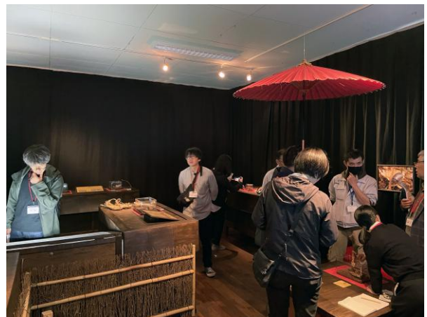
エクスカージョンの様子

研修会となりました。講義の後には、参加者が持参したデジタルカメラで縄文土器や民具資料、剥製資料など様々な資料を撮影し、持参したパソコンで