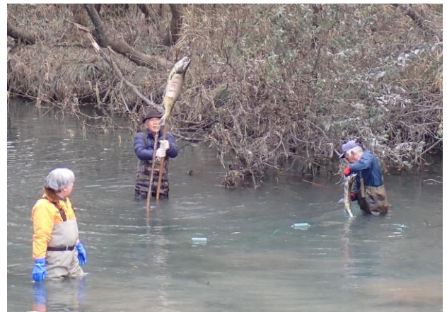
マレク（鉤）によるサケ漁の見学

現在、多くの自治体が、アイヌ政策推進交付金事業に取り組んでおり、それぞれに特徴があります。このたびの視察は、当該交付金の活用事例を実地に知る良い機会となりました。